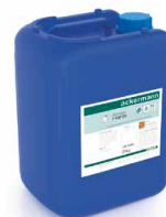
Reiniger und Klarspüler